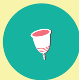
COUPES MENSTRUELLES NEUVES