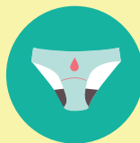
CULOTTES MENSTRUELLES NEUVES

Les paquets entamés et produits en vrac sont acceptés à condition qu'ils soient emballés individuellement.